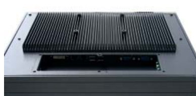
Core™ i Modelle