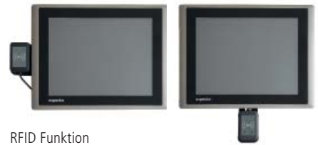
RFID Funktion rechts, links oder unter dem Display