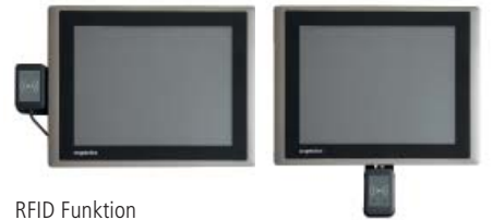
RFID Funktion rechts, links oder unter dem Display