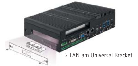
2 LAN am Universal Bracket